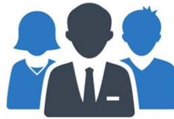
Une affaire d'experts