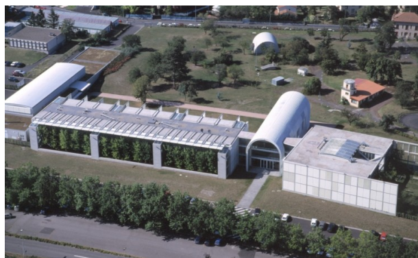
Cemagref, centre de Clermont-Ferrand

Les journées EDA 2011 sont organisées par le Cemagref de Clermont-Ferrand en liaison avec les Universités clermontoises.